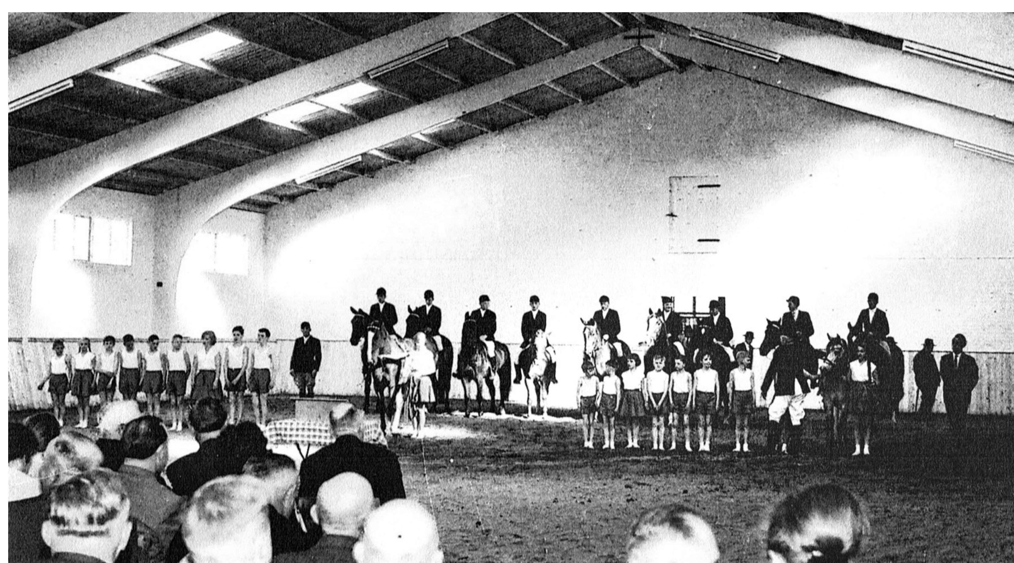
Die aktiven Reiter des Pr. Ströher Vereins und die Voltigiergruppe haben in der Halle zu deren Einweihung Aufstellung genommen.

Die im Grünen liegende Anlage an der Großen Aue wurde über die Jahre immer mehr ausgebaut. So fand die Einweihung der sogenannten „Hubertus-Reithalle“ am 6. Mai 1960 statt. Später wurde ein Erweiterungsbau mit Stallungen durchgeführt.