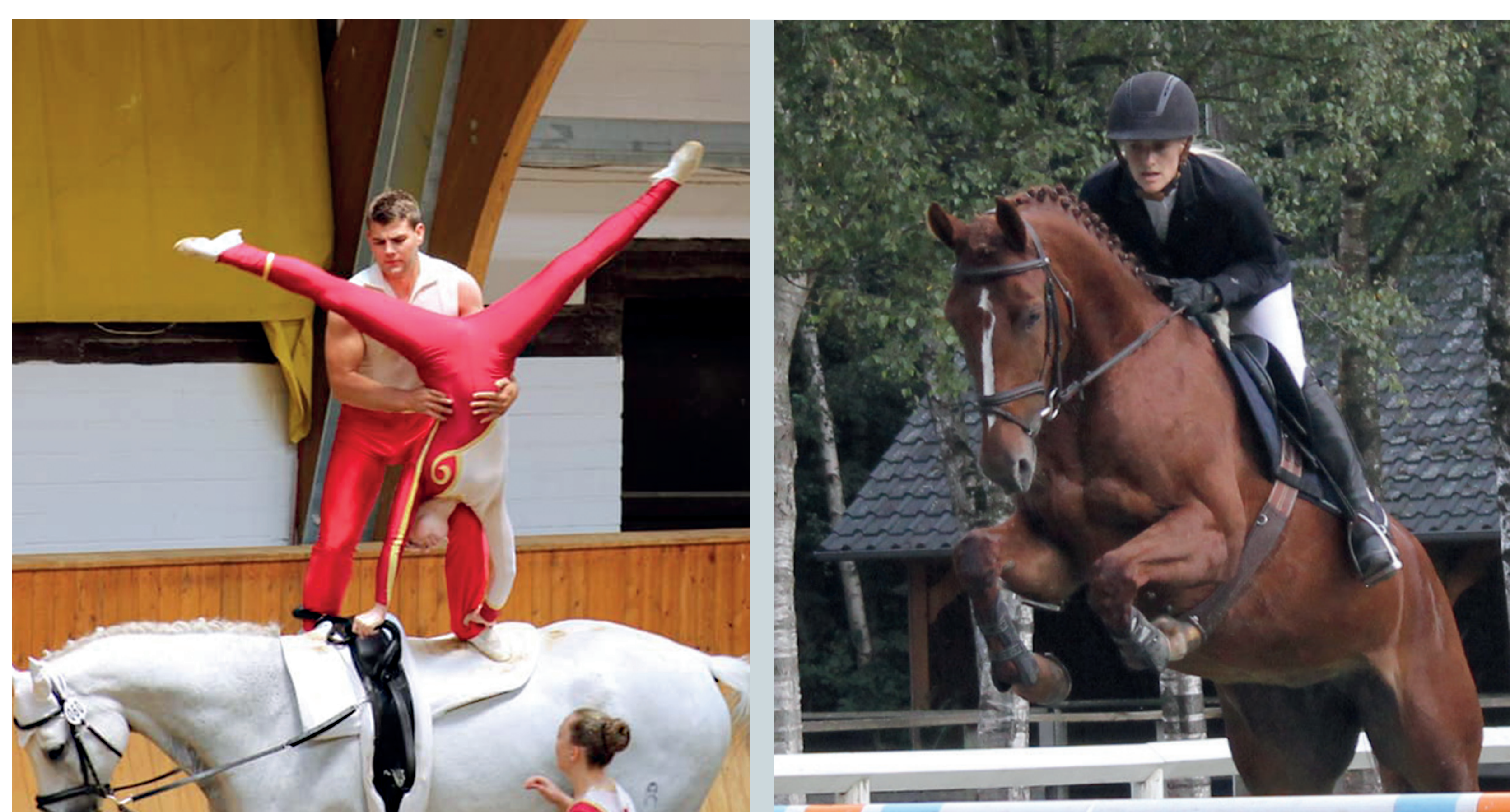
Nach dem Krieg entwickelte sich in Pr. Ströhen parallel zum Reitsport zunehmend auch der Voltigiersport. Heute findet neben dem Himmelfahrtsturnier alle zwei Jahre ein Voltigierturnier in der Halle statt.

Der Reiterverein ist über die letzten 100 Jahre stetig gewachsen. Mit annähernd 250 Mitgliedern, 6 Voltigiergruppen und vielen Pferdefreunden ist er im Herzen von Pr. Ströhen zu Hause. Das jährliche Himmelfahrtsturnier bietet auch nach fast 100 Jahren attraktiven Pferdesport auf hohem Niveau.