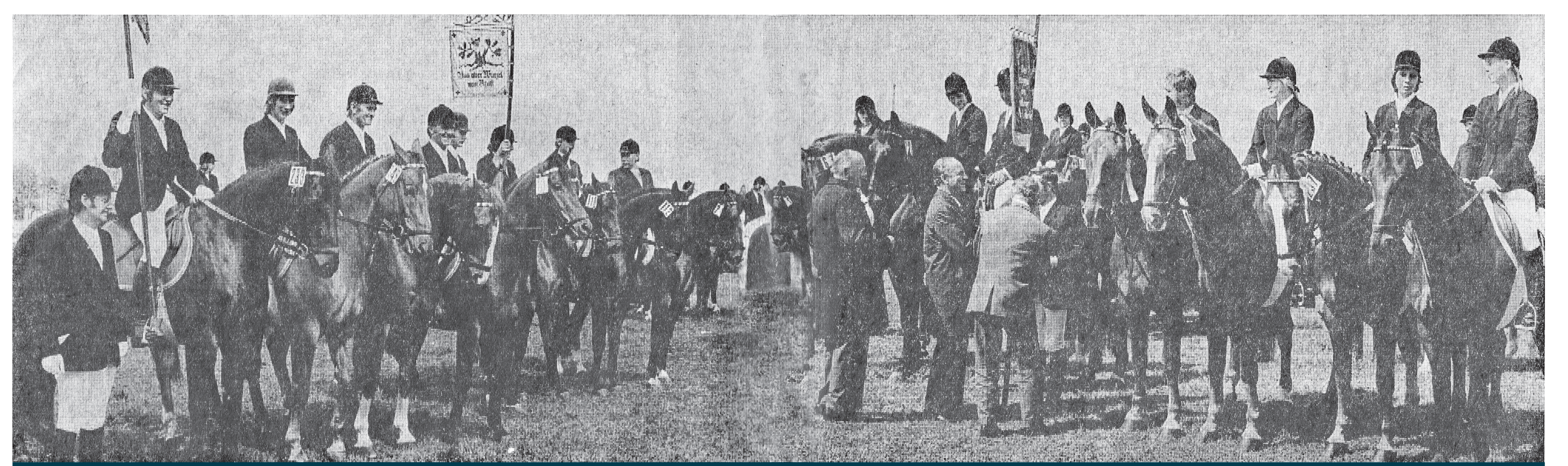
Ein imposantes Bild bot der alljährliche Aufmarsch der Reiterabteilungen zur Übergabe der Kreisstandarte und des Jugend-Wanderpokals. Das Bild zeigt die beiden Reiterabteilungen von Oberbauerschaft und Pr. Ströhen, die sich 1974 im Abteilungswettkampf um die Kreisstandarte Lübbecke an die Spitze setzen konnten.

Als 1975 dann der Pachtvertrag für den alten Platz zwischen dem Besitzer Hartlage-Fangmann Nr. 3 und dem Reiterverband auslief, übernahm der Reiterverein Pr. Ströhen die Ausrichtung des Turnieres auf dem Vereinsgelände an der Großen Aue.