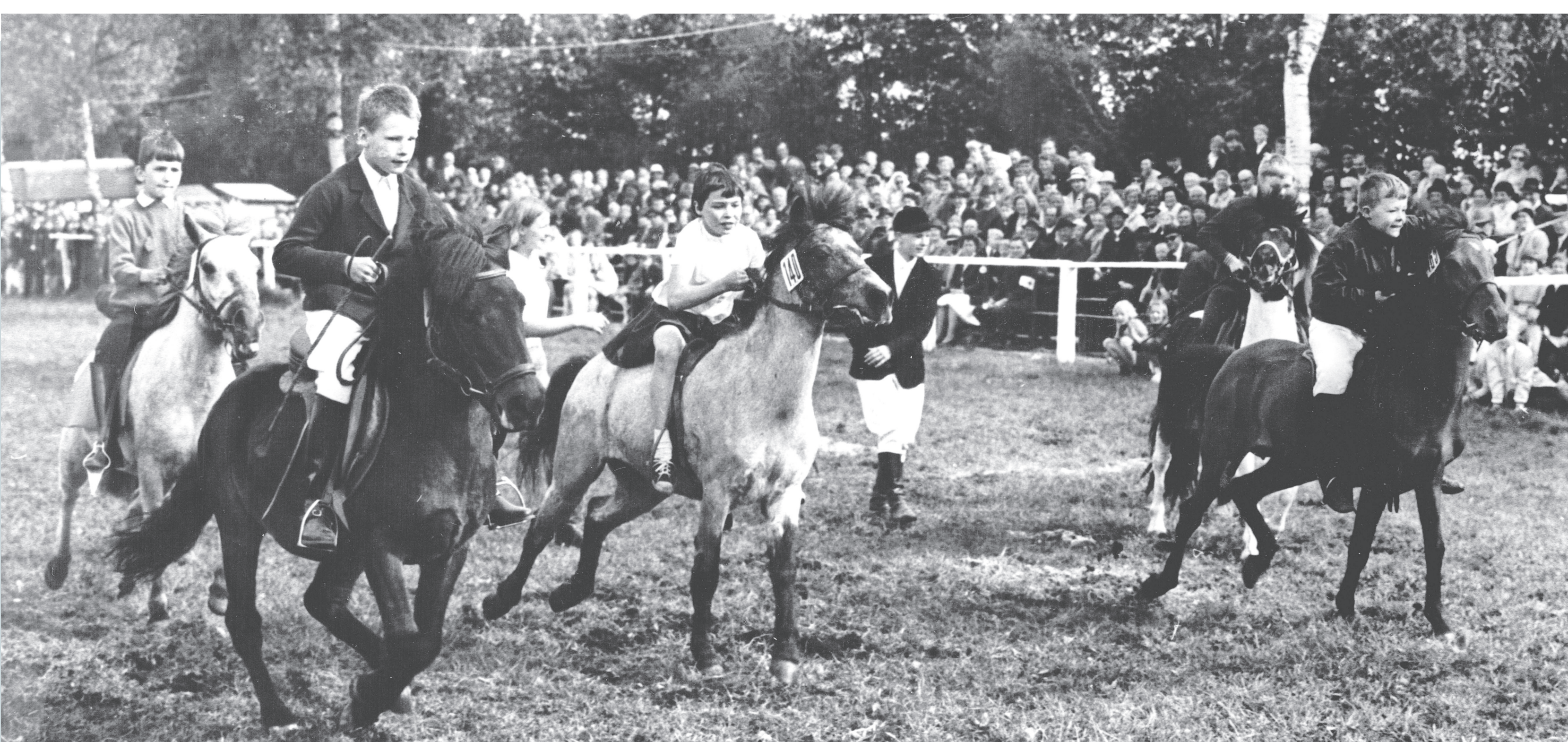
Mit Ponyrennen wurde auch die Jugend in das Renngeschehen einbezogen. Im Hintergrund ist die Zuschauertribüne zu sehen, die an Start und Ziel neben dem Richterhäuschen aufgebaut war.