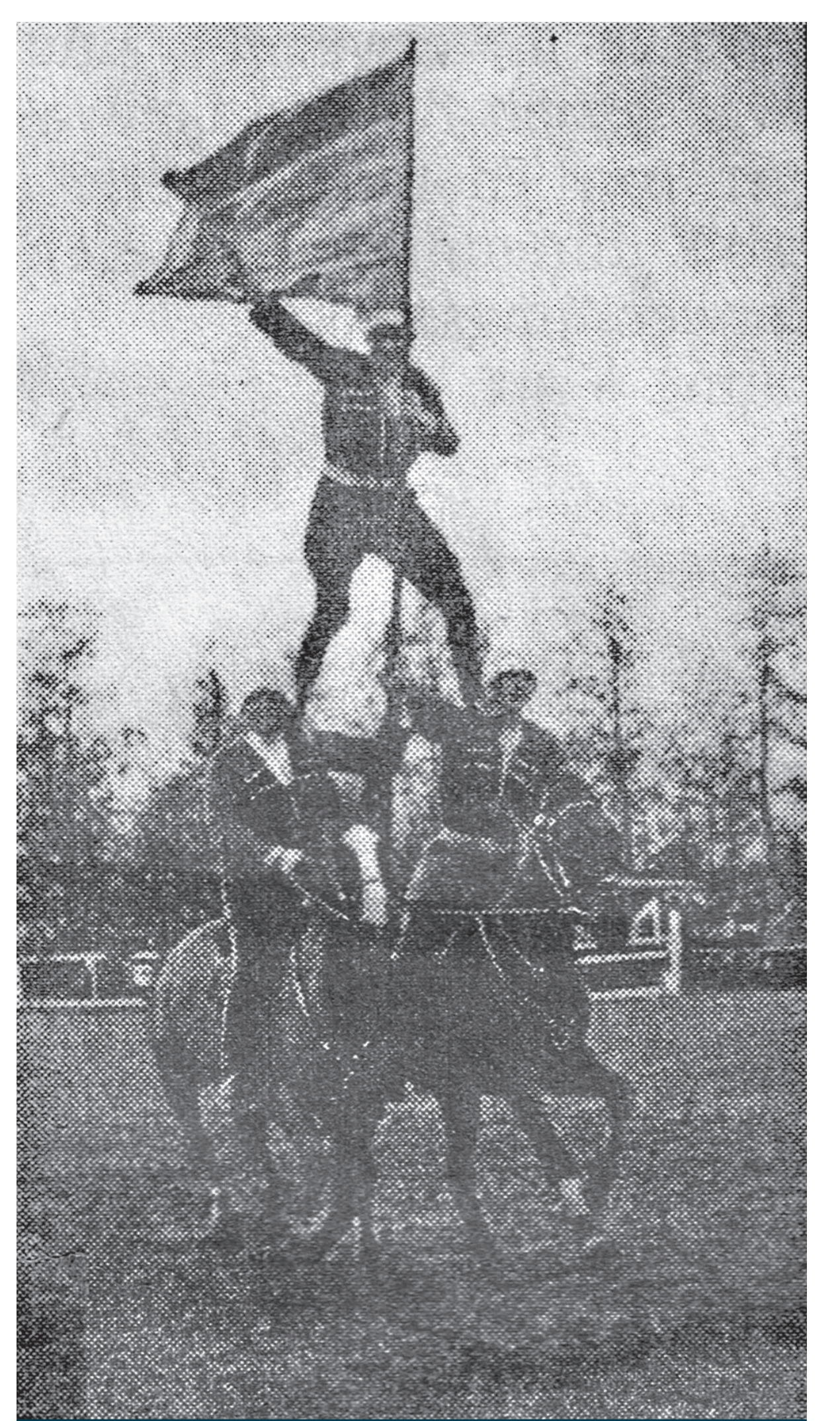
Die waghalsigen Vorführungen der „Kuban-Kosaken Reitertruppe“ sorgten für riesige Beifallstürme.

Die Inflation begleitete 1923 den Verlauf des Himmelfahrtsturnieres. „Am Sonntag dem 15. Juli (...) findet auf der Rennbahn in Pr. Ströhen in der Nähe der Haltestelle Neuer Krug, Bahnstrecke Herford Rahden-Bassum das 2. Turnier des Pferdezucht- und Reitervereins des Kreises Lübbecke statt. Eintrittskarten kosten im Vorverkauf 8000 Mark, am Veranstaltungstag an der Kasse 2000 Mark Aufschlag. Zuschlagskarten für Sitzgelegenheiten zu 5000 Mark sind an der Kasse zu haben.“ So hieß es in der Anzeige des Verwaltungsrates des Vereins. Die Veranstaltung fand damals am 2. Juli statt, später wurde sie auf den Himmelfahrtstag verlegt.