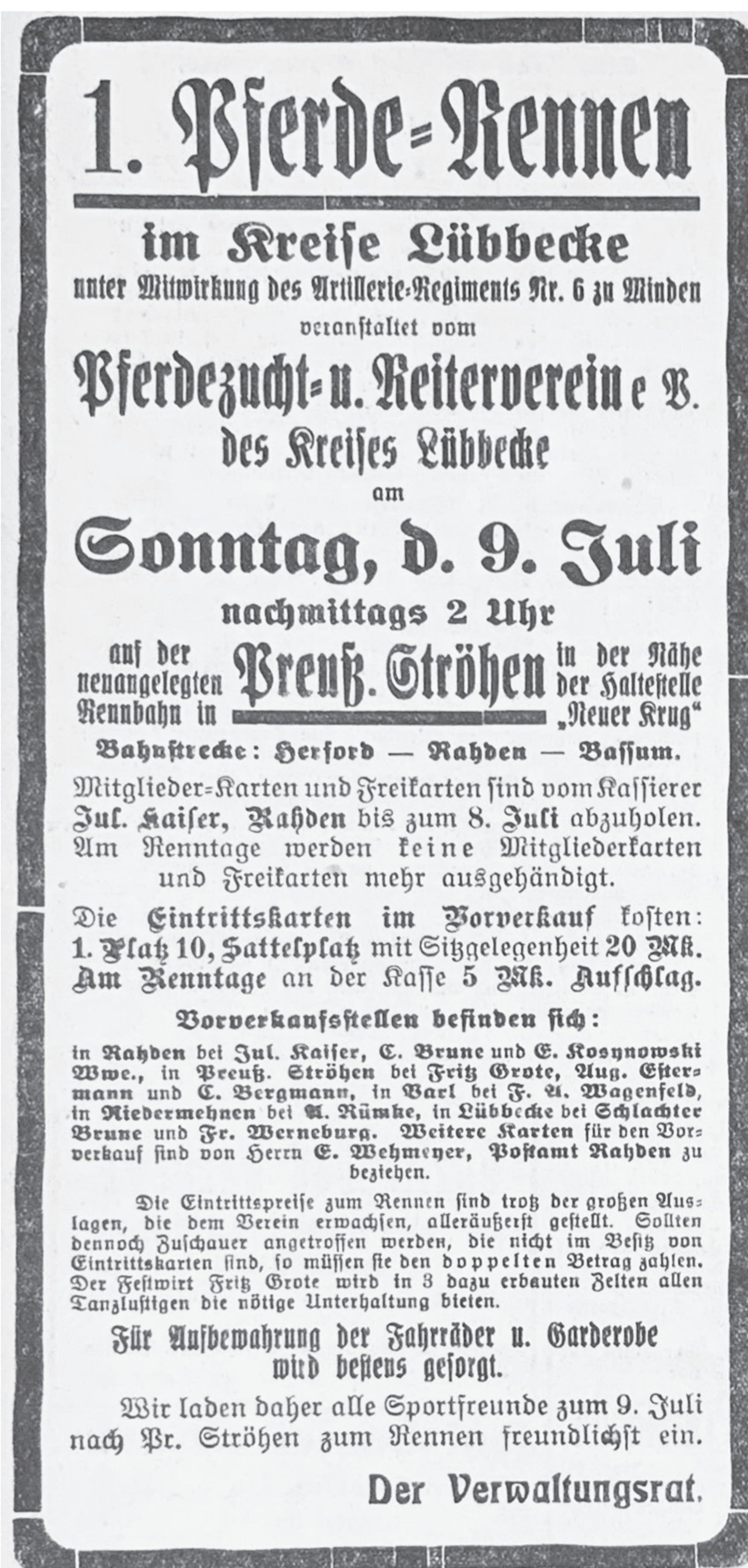
Eine Anzeige, die das erste Pferde-Rennen auf der Halge bewirbt, aus dem Lübbecke Kreisblatt vom 3. Juli 1922

Einst war es der Pferdezucht- und Reiterverein des Kreises Lübbecke, der die Traditionsveranstaltung „Ströher Rennen“ unter der späteren Bezeichnung „Himmelfahrtsturnier“ im Jahr 1922 ins Leben rief.